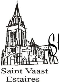
Saint Vaast Estaires

Notre mission : annoncer le pardon et l'amour de Dieu