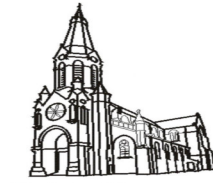
Saint Pierre La Gorgue