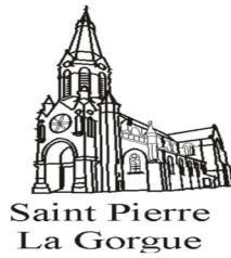
Saint Pierre La Gorgue