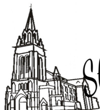
Saint Vaast Estaires