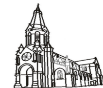
Saint Pierre La Gorgue