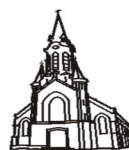
Sacré Coeur Nouveau Monde