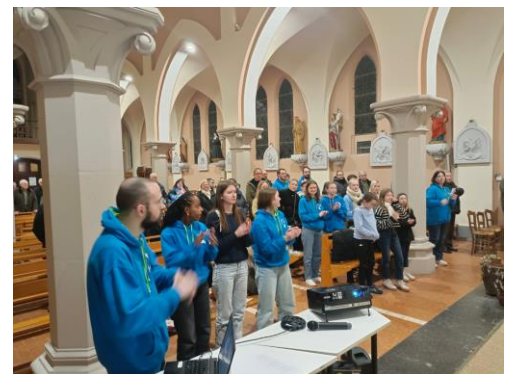
➤ 19 janvier : Vœux et partage de la lumière de Bethléem.