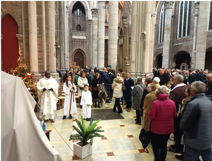
➤ 11 janvier : Messe des jeunes de l'aumônerie.